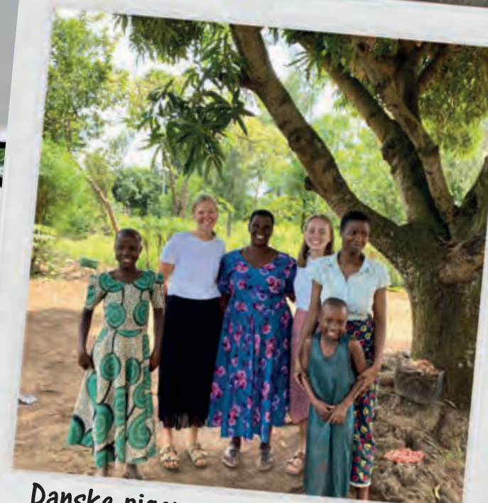
Danske piger sammen med kristne søstre i Tanzania.

Voel Børneklub, Aakirkeby Børneklub og LM's junior- og teenklub i Videbæk.