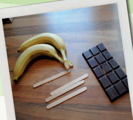
HER ER HVAD DU SKAL BRUGE

Vask vindruerne og sæt dem på grillspyd. Frys i mindst to timer.