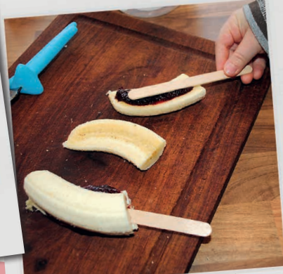
SÆT BANANEN PÅ EN ISPIND