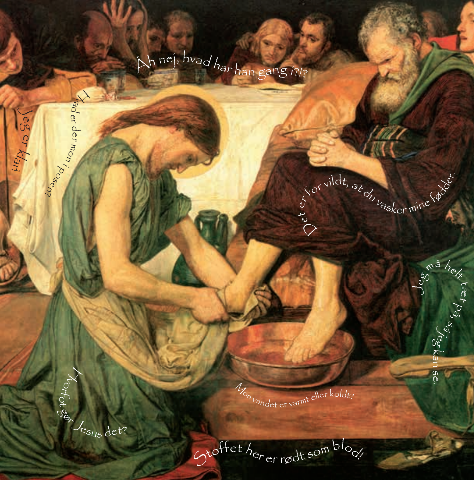
MALERI FORD MADOX BROWN

”Jesus rejste sig nu fra det sted, hvor han lå ved bordet, og tog sin yderkjortel af. Så hev han op i inderkjortlen og bandt et håndklæde om sig som bælte. Derefter hældte han vand i et vandfad og gav sig til at vaske disciplenes fødder, mens de lå på deres pladser rundt om bordet, og han tørrede deres fødder med det håndklæde, han havde om livet.”